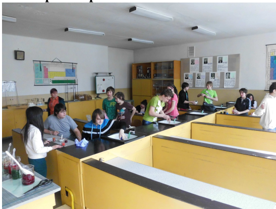
Učebna Ch a Fy