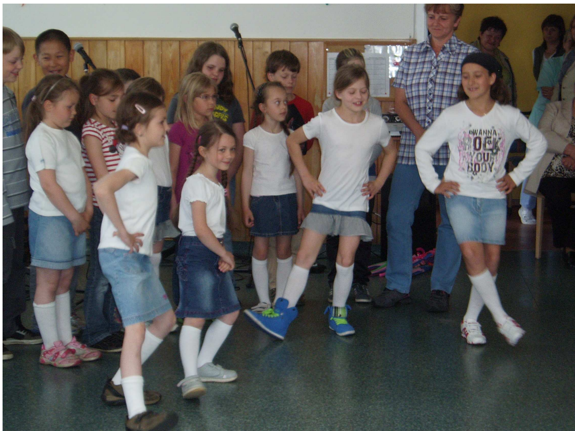
Dům seniorů v Perninku